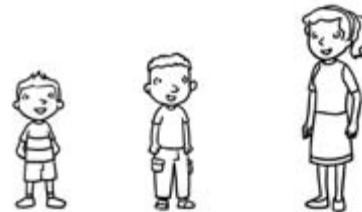
alto más alto el más alto